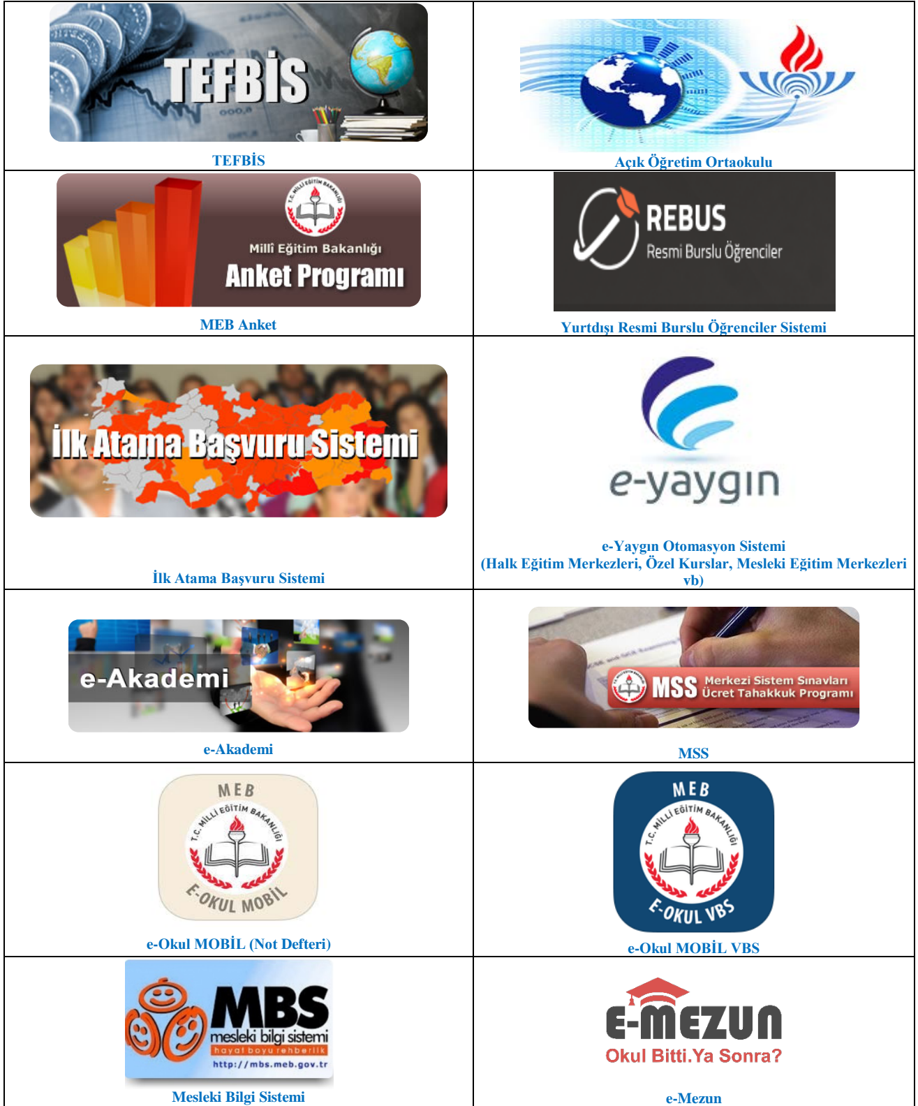
Tablo 1: WEB Tabanlı Çalışmalar