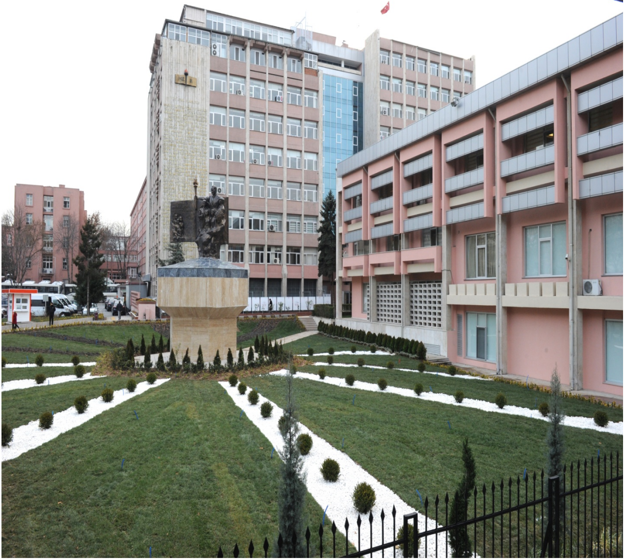
Resim 1: Millî Eğitim Bakanlığı Kızılay Merkez Bina

Bakanlığımız Ankara'da; Kızılay, Beşevler, Teknik Okullar, Gölbaşı ve Hasanoğlan olmak üzere 5 ayrı semtte 22 ayrı binada hizmet vermektedir.